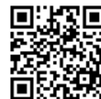
表 3 農村環境營造走讀培訓體驗問卷調查表

線上問卷網址： https://forms.gle/3j6fi1LUbqBVUtnaA