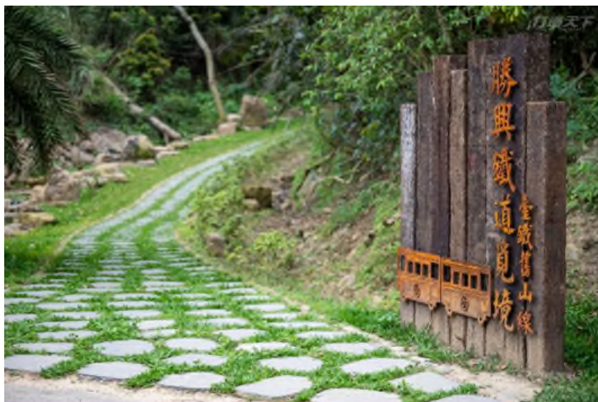
圖 1 勝興鐵道覓境步道